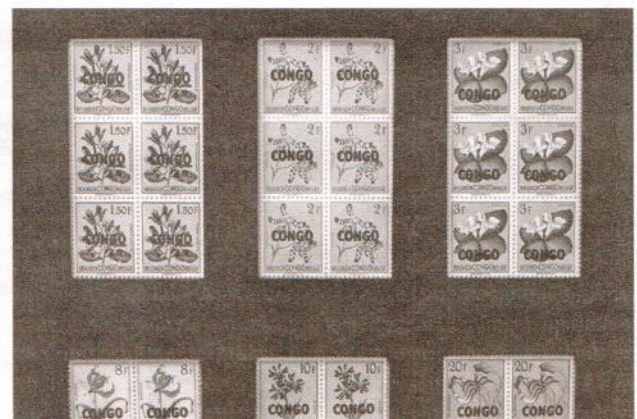
The Otolith Group

The Common Sense , 2014, presentatie in Casco – Office for Art, Design and Theory, Utrecht.